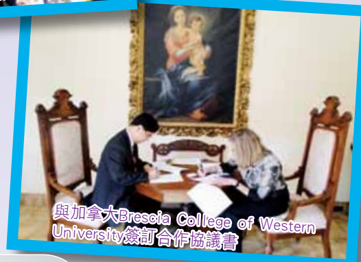
與加拿大Brescia College of Western University簽訂合作協議書