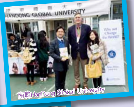
南韓HanDong Global University