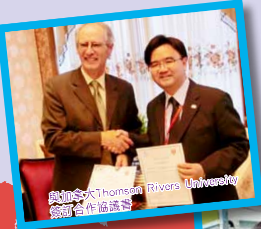
與加拿大Thomson Rivers University 簽訂合作協議書