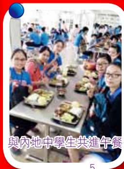
與內地中學生共進午餐