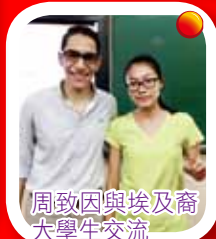
周致因與埃及裔大學生交流