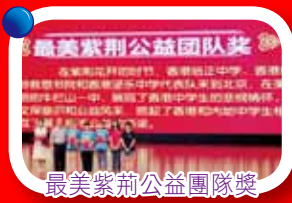
最美紫荊公益團隊獎