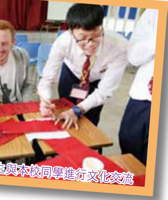
與本校同學進行文化交流