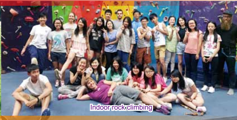
Indoor rock climbing