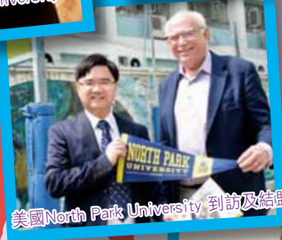
美國North Park University 到訪及結盟