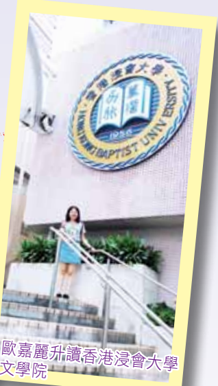
歐嘉麗升讀香港浸會大學 文學院