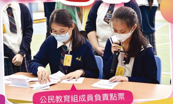
公民教育組成員負責點票

本校一年一度的學生會選舉於10月21日圓滿結束。全體同學以一人一票方式，選出了本年度的學生會內閣。內閣 Aurora 在 293 票支持、63 票反對、19 票棄權下成功當選。內閣成員的投入和教師背後的鼎力支持讓同學除可體驗代議政制中推選代表的精神和程序外，亦上了一次寶貴的公民教育課。