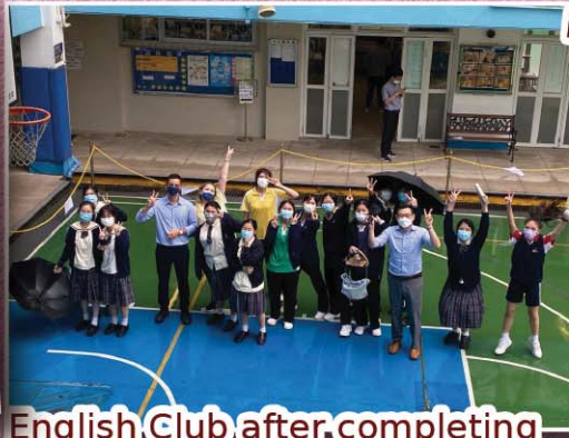
English Club after completing a very successful Egg Drop challenge!