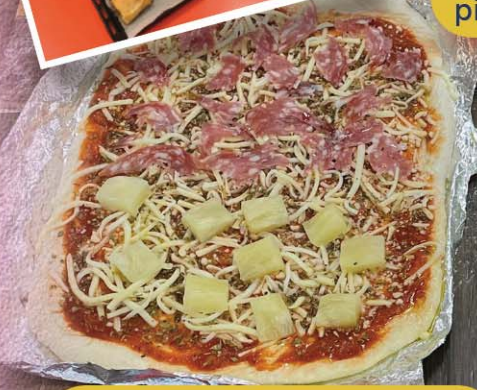
Some delicious pizzas made by club members