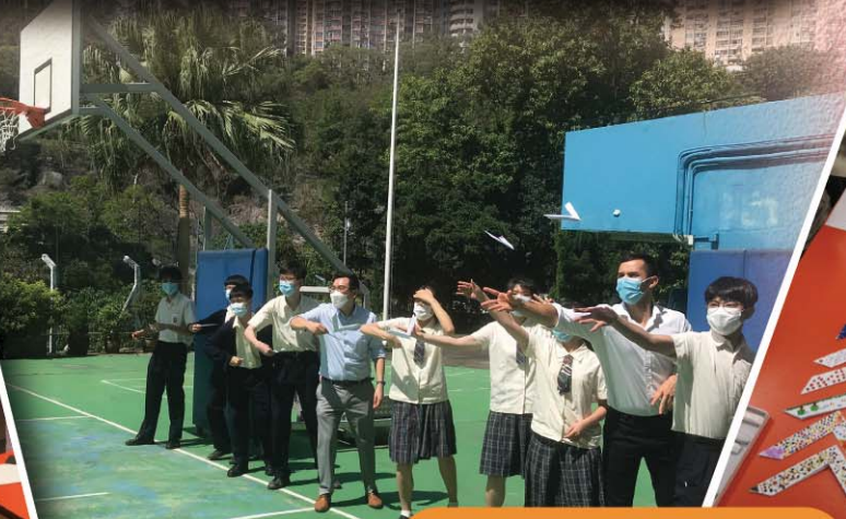
Students testing out their handmade boomerangs