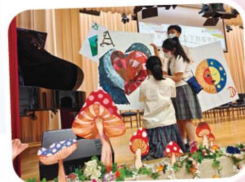
學生以愛麗思夢遊仙境佈置畢業典禮

還記得 12 月觀塘區疫情嚴峻，我們連 1/6 的面授課也要突然叫停。福音周要改為網上進行，師生齊心參與製作網上大合唱《平安》；聖誕慶祝無法實體進行，學校為大家首次舉行聖誕網上大抽獎，老師為大家安排網上聖誕聯歡。另外，為了高中的同學，我們向考評局提出要精簡 SBA、取消口試、讓學生回自己學校考 DSE，大部份措施也得到落實。這些好事，大家只有在這一年才經歷過。所以，疫情可以令世界變得灰暗，亦可以讓我們展現溫情，即使在灰暗的處境，我們也可以盡自己的努力為世界加添色彩，做個堅毅感恩的人。