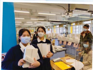
同學領取 BYOD 的 iPad

今年中六的畢業典禮，同學選擇以愛麗思夢遊仙境為佈置的主題，寓意我們已進入了不一樣的世界，每一場景也不可預知，會面對重未遇見過的新挑戰，要隨機應，過程中或許會受傷，亦會有突破，然後大家會變得更堅強、更喜樂，成為真正堅強喜樂的人！