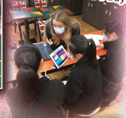
Ms Caeti helps students with their quiz all about International Women's Day!