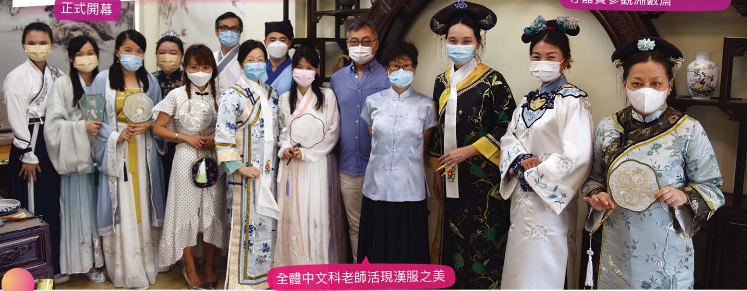
全體中文科老師活現漢服之美