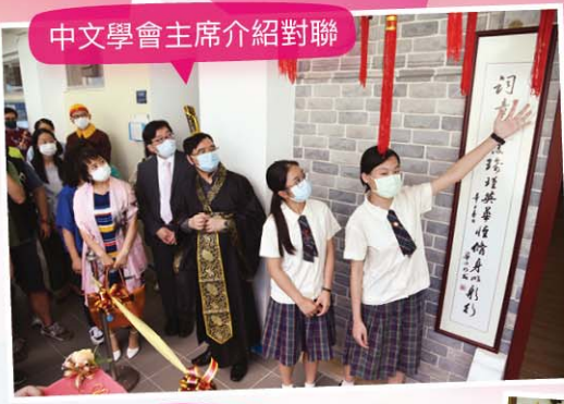
中文學會主席介紹對聯

淵藪讀音「鴛」、「手」。淵藪是聚集之意，齋是書齋。盼學生在其中寒窗苦讀、研究書法、品茗，發現中國文化的博大精深，鍾情當中瑰麗文明，律己修身。