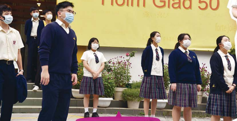
選舉日聲嘶力歇宣傳