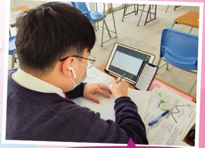
電子學習也紙筆不離手

這學年充滿的是變數，不可規劃，要隨機應變。面授課時間大幅減少，看似失去了很多，但我們在困難中，取得的突破也不少。