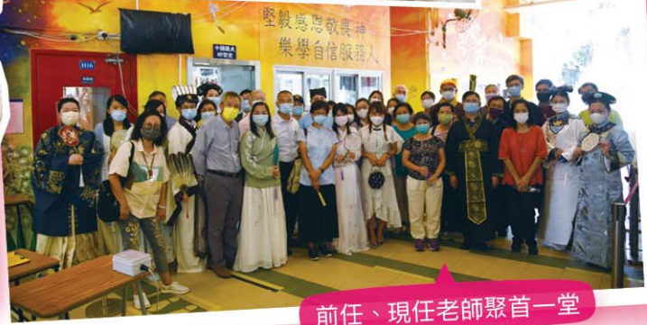
前任、現任老師聚首一堂