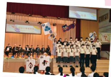
在疫情下畢業的學生迎接不一樣的挑戰

今年中六的畢業典禮，同學選擇以愛麗思夢遊仙境為佈置的主題，寓意我們已進入了不一樣的世界，每一場景也不可預知，會面對重未遇見過的新挑戰，要隨機應，過程中或許會受傷，亦會有突破，然後大家會變得更堅強、更喜樂，成為真正堅強喜樂的人！