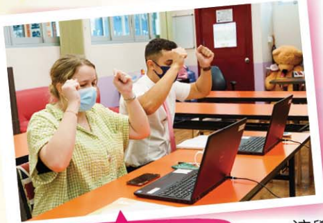
外籍老師上網課手舞足蹈

這學年充滿的是變數，不可規劃，要隨機應變。面授課時間大幅減少，看似失去了很多，但我們在困難中，取得的突破也不少。