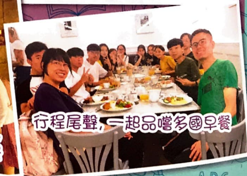
行程尾聲，一起品嚐多國早餐