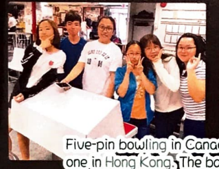
Five-pin bowling in Canada is different from the one in Hong Kong. The ball is lighter, and smaller.