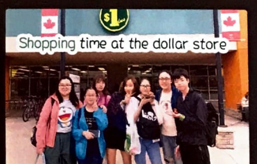
Shopping time at the dollar store