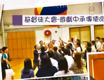
基督徒大會-遊戲中承傳使命