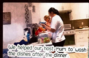
We helped our host mum to wash the dishes after the dinner.