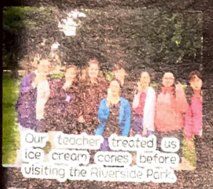
Our teacher treated us ice cream cones before visiting the Riverside Park.

Seven students took part in a 15-day programme which was called Canada Culture & English Summer Camp organized by CCCEA. They had English lessons at TRU (Thompson Rivers University) and various activities in Kamloops such as horseback riding and kayaking. They stayed in different host families experiencing the Canadian cultures which made this trip fruitful and memorable.