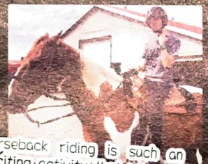
Horseback riding is such an exciting activity that we need to control the horses carefully!