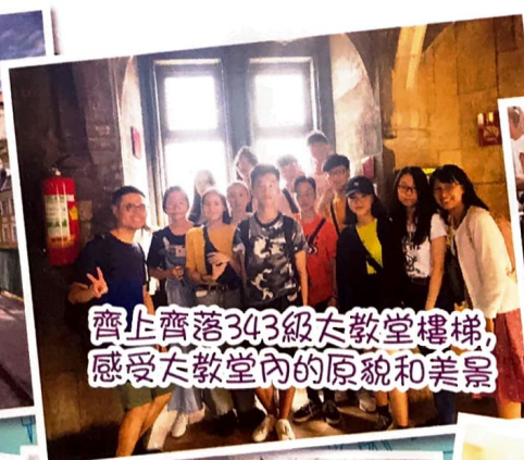
齊上齊落343級大教堂樓梯， 感受大教堂內的原貌和美景