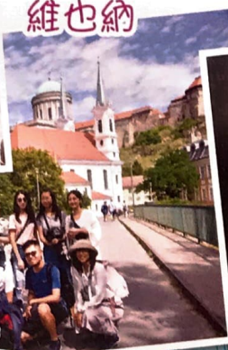
漫遊埃斯泰爾戈姆