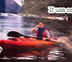
It was cool and fun travelling in a kayak at North Barriere Lake!