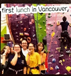
Our first lunch in Vancouver.