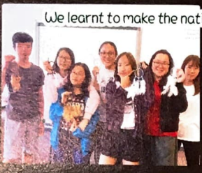
We learnt to make the native artwork—dreamcatcher.