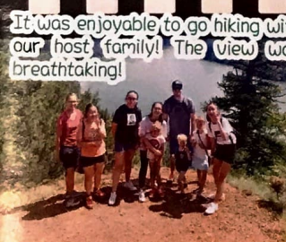
It was enjoyable to go hiking with our host family! The view was breathtaking!