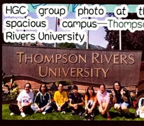
HGC group photo at the spacious campus—Thompson Rivers University