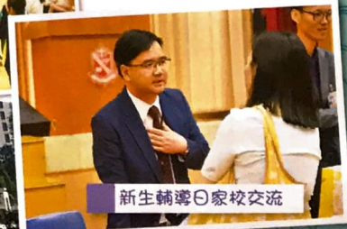
新生輔導日家校交流