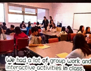
We had a lot of group work and interactive activities in class.