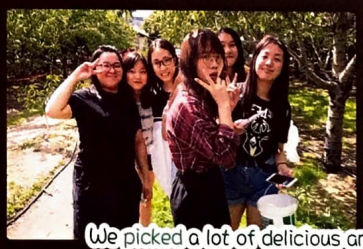
We picked a lot of delicious and juicy cherries at an orchard.