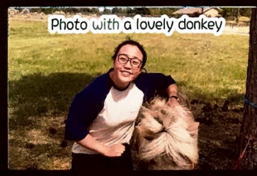
Photo with a lovely donkey