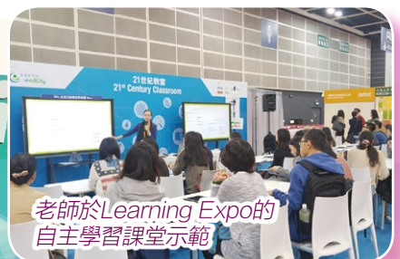
老師於Learning Expo的自主學習課堂示範