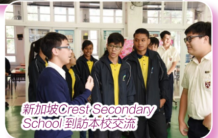
新加坡Crest Secondary School到訪本校交流