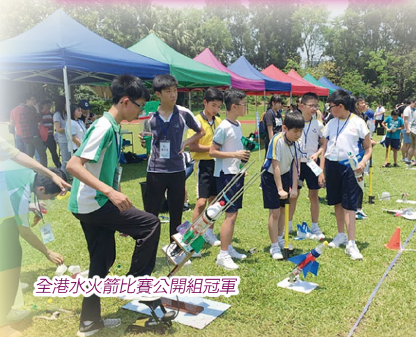
全港水火箭比賽公開組冠軍