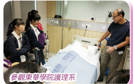
參觀東華學院護理系

我相信不是每一位同學也能在這校刊找到自己獲獎的報導，但我希望每一位同學也能找到自己努力過的痕跡，找到自己過去一年過得精彩的點滴，見證自己成長。