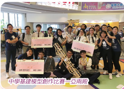
中學基建模型創作比賽一亞兩殿