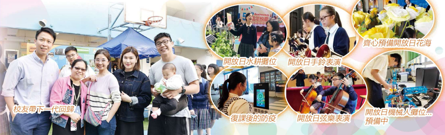
校友帶下一代回歸