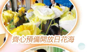
齊心預備開放日花海