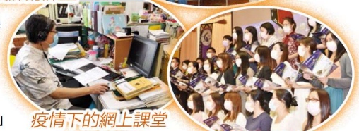
疫情下的網上課堂