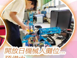
開放日機械人攤位...預備中