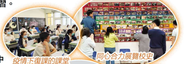
疫情下復課的課堂